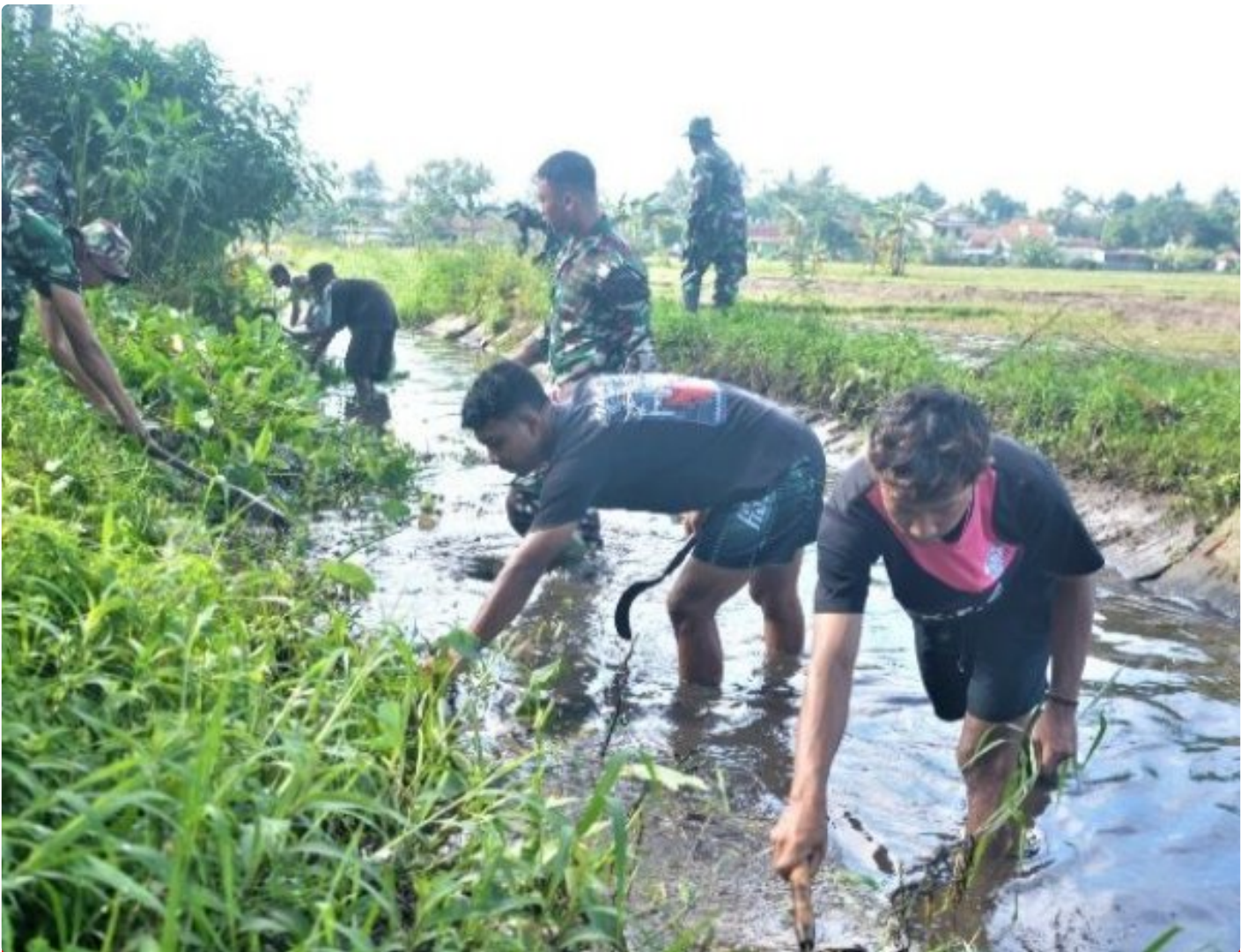
Sungai Si Rompang dibersihkan TNI Korem 071 Wijaya Kusuma

BANYUMAS - Sungai Si Rompang atau kali dalam sebutan masyarakat